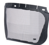
Osłony twarzy serii 5